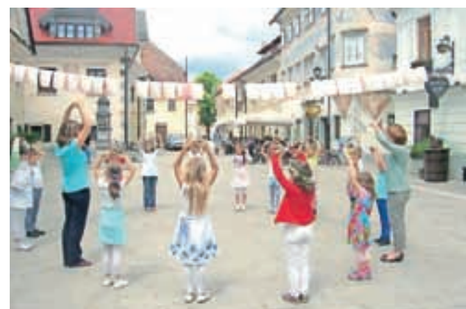
Nastop učencev waldorfske šole na Linhartovem trgu v Radovljici