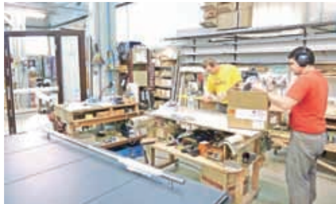
Vhodna vrata so v celoti izdelana na Bledu.