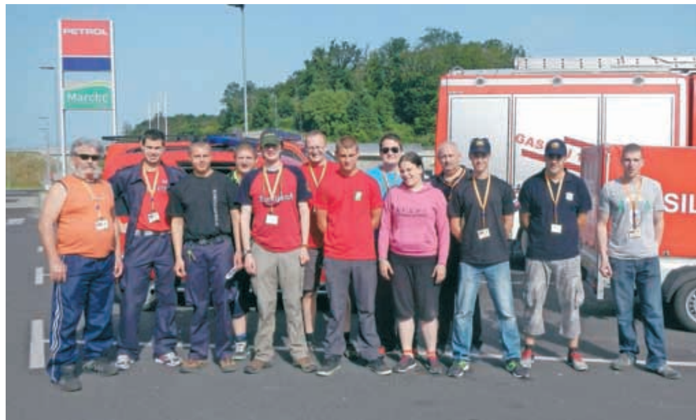
Ekipa Gasilske zveze Radovljica je na pomoč v Svilajnac odšla s črpalkami.