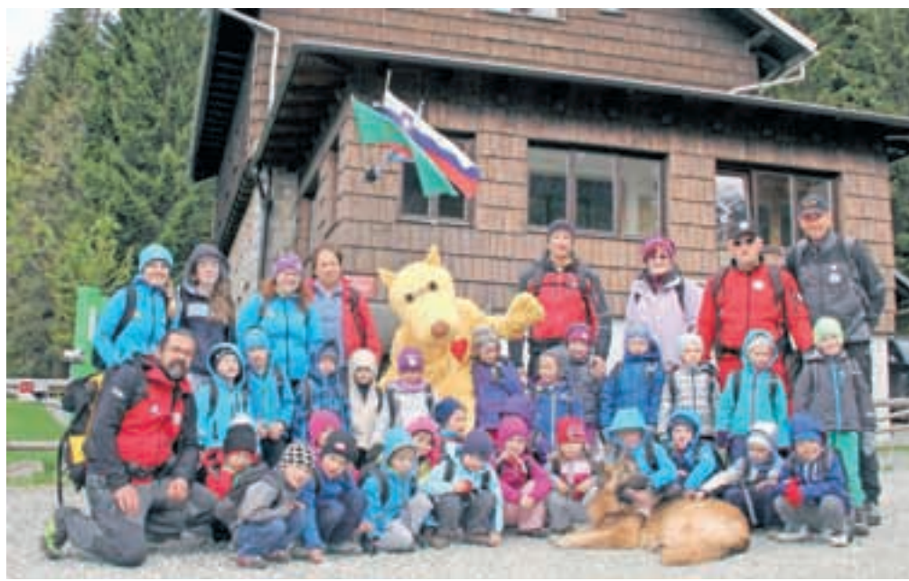
Cilj poti: Valvasorjev dom pod Stolom