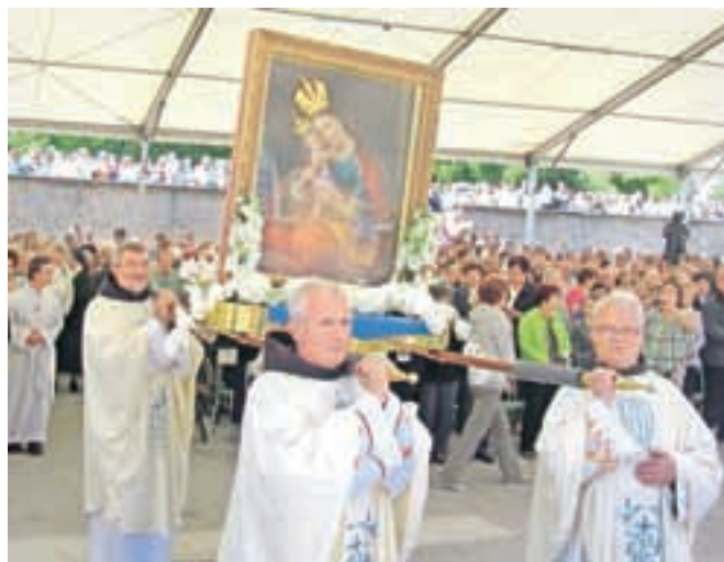
Slika Marije Pomagaj med brezjanskimi romarji