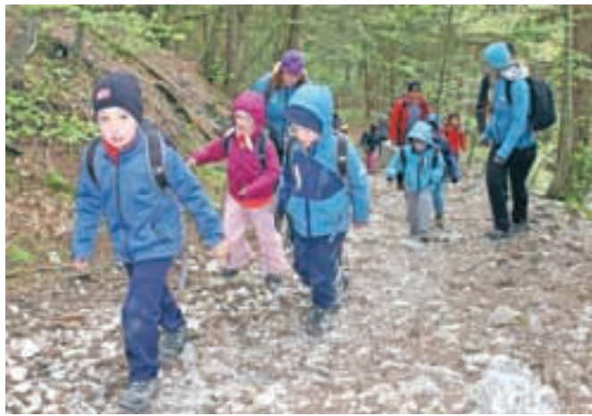
Med potjo in v planinskem domu so se naučili veliko koristnega.