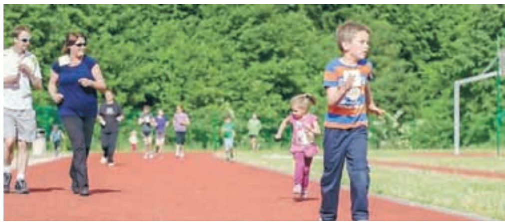
Čudovit pozno pomladni dan je bil kot nalašč za športne aktivnosti na prostem.