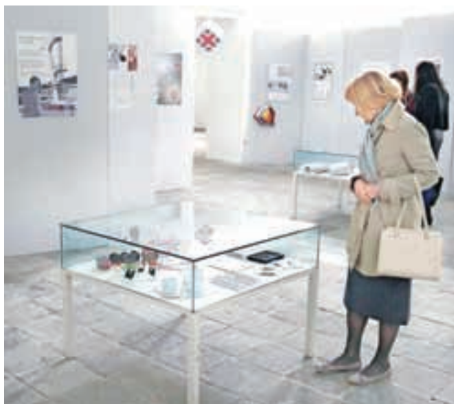
Študentje Fakultete za arhitekturo in Akademije za likovno umetnost in oblikovanje so na razstavi predstavili svoje ideje za darila z Vurnikovimi motivi.

Ivan Vurnik je bil rojen v Radovljici, v znani podobarški oziroma kamnoseški družini. Arhitekturo je študiral na Visoki tehnični šoli na Dunaju, kjer je po študiju dve leti deloval kot pomožni arhitekt izgradnje novega cesarskega dvora, dunajskega Hofburga. Leta 1919 se je vrnil v Ljubljano, kjer