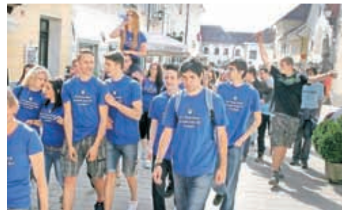
Od štirih let v dijaških klopeh so se v starem mestnem jedru Radovljice poslovili s četvorko.