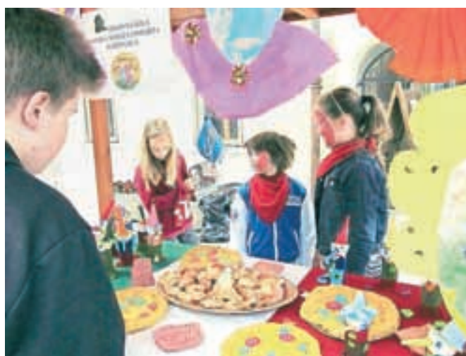
Radovljiška osnovna šola je na eni od stojnic predstavljala Italijo in dišalo je tudi po italijanski pici ...