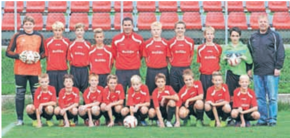
Odlična ekipa mladih nogometašev sekcije U15 nogometnega kluba Šobec Lesce