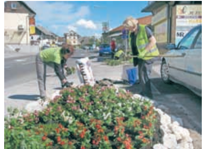
Gredice v Lescah in okolici so člani hortikulturnega društva tudi letos zasadili z rožami.