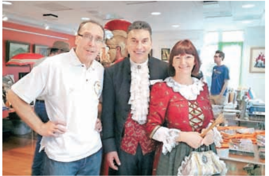
Živahno dogajanje na slovenskem veleposlaništvu v Washingtonu.

"Kar. Najprej si je bilo treba zagotoviti čim bolj ugodne vozovnice. Saj veste, prej ko kupiš letalsko karto, tem ceneje letiš. Ker nismo želeli predstaviti samo gotovih lectarskih izdelkov, ampak tudi postopek, smo šli na