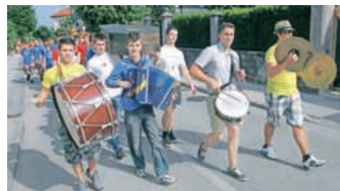
Maturanti so se iz obeh srednjih šol v bučnem sprevedu odpravili do Linhartovega trga.