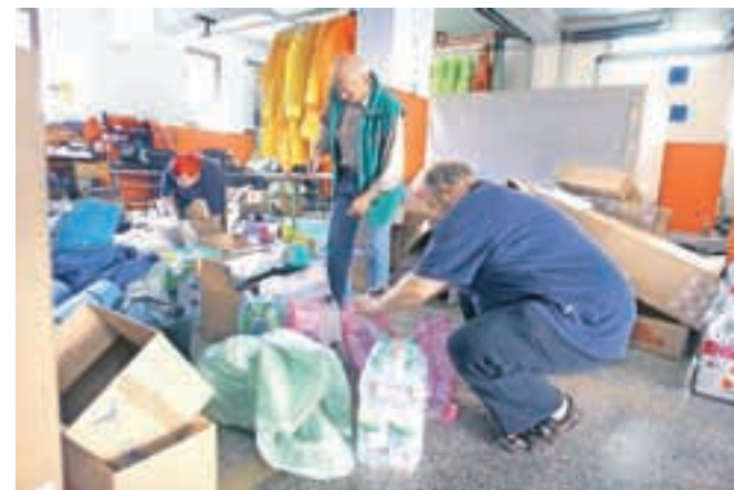
Vsa občina je zbirala pomoč za poplavljenih.

Takoj po prihodu so začeli delati in se domov vrnili v torek, 27. maja; vsi iz ekipe so za čas, ki so ga preživeli na humanitarni akciji, kori-